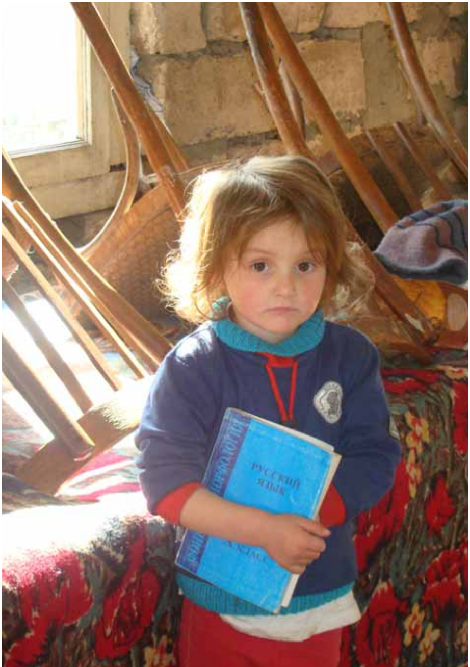
sofel i Sindisi, 12 oqtomberi, 2008 wel i