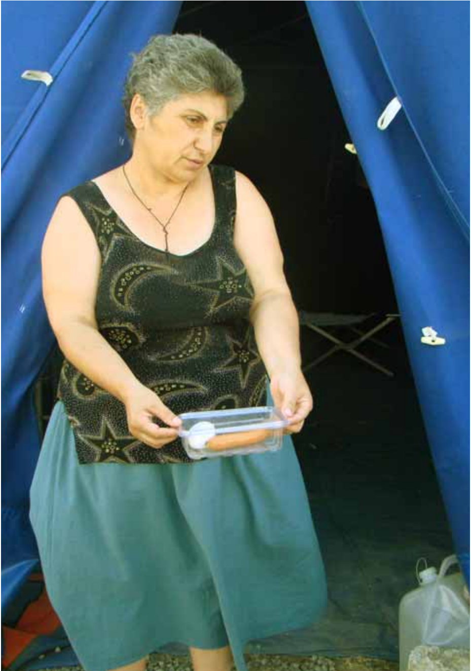
gori, 12 seqtemberi, 2008 wel i kuTvmil i ul ufa