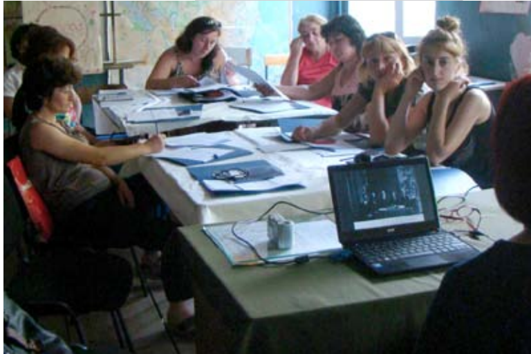
ტრენინგი პროექტ „ქალები, როგორც აქტორები ცვლილებებისა და გაძლიერებისათვის“ ფარგლებში შექმნილი 15 თვითდახმარების ჯგუფის წევრებისთვის გაიმართა.

პროექტის სამიზნე რეგიონებში შერჩეული თვითდახმარების ჯგუფების წარმომადგენლებმა ინფორმაცია მიიღეს საქართველოს ისტორიაში ქალთა უფლებების დაცვისთვის გადადგმულ ნაბიჯებზე, ქალთა დისკრიმინაციის ყველა ფორმის აღმოფხვრის კონვენციის შესახებ, ასევე განიხილეს დისკრიმინაციის სხვადასხვა ფორმები და მათი აღმოფხვრის გზები.