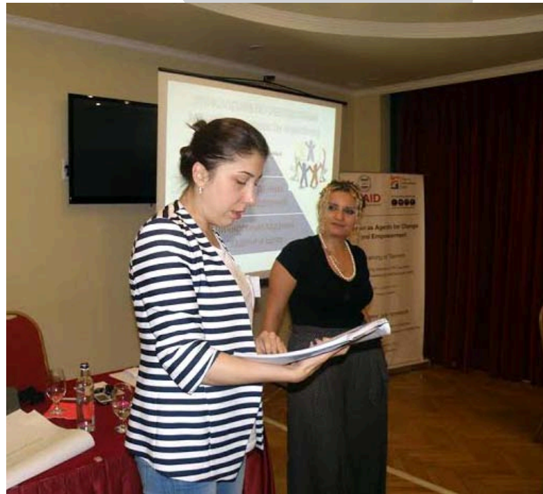
გაზრდა, ოფიციალურ სამშვიდობო მოლაპარაკებების პროცესებში ქალთა მონაწილეობის წახალისება და მათი ინტერესების გათვალისწინება.

პროექტის „ქალები, როგორც აქტორები ცვლილებებისა და გაძლიერებისთვის“ ფარგლებში ქალთა საინფორმაციო ცენტრი ომისა და მშვიდობის გაშუქების ინსტიტუტთან ერთად ახორციელებს ერთერთ საკვანძო კომპონენტს, რომლის ამოცანებია დიალოგისა და ნდობის აღდგენის შესაძლებლობების